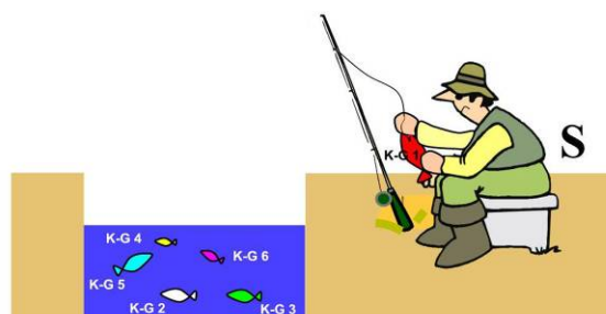
IL MERCATO OBIETTIVO